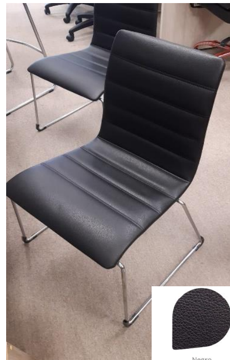
Silla tipo Lyon trineo. Tapizado color negro simil cuero