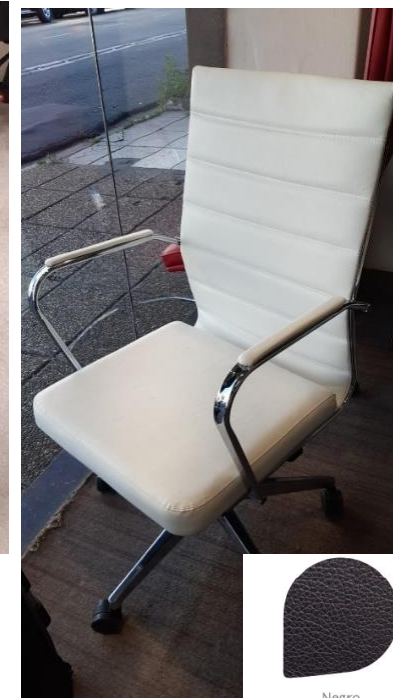
Silla gerencial mediana tipo Tango 900. Tapizado color negro simil cuero