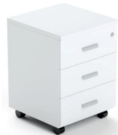
Cajonera rodante 0,45 x 0,45 x 0,64 mts. con tres cajones (Melamina color ceniza; herraje aluminio)