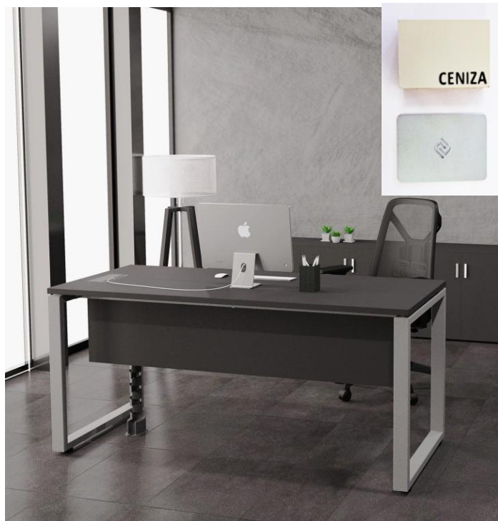
Puesto jerárquico. Tapa: 1,40 x 0,70 mts. y credenza 1,35 x 0,44 mts. (Melamina color ceniza; pata arco color aluminio; herraje aluminio)