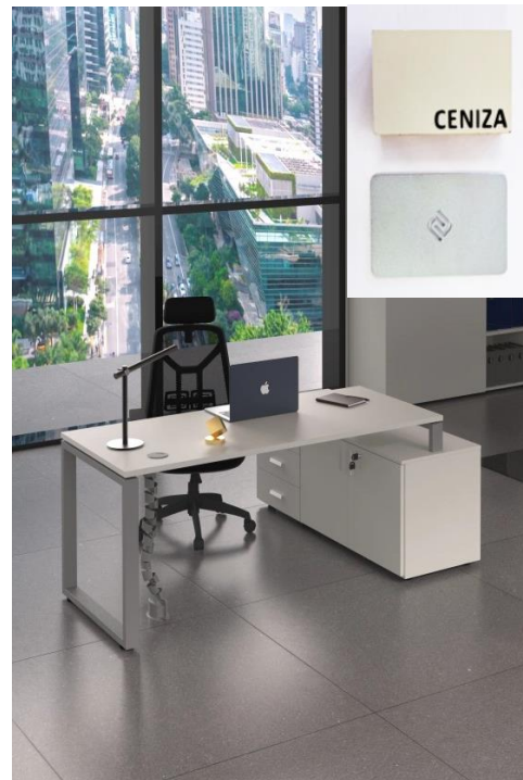
Puesto individual. Tapa: 1,20 x 0,70 mts. (Melamina color ceniza; pata arco color aluminio)