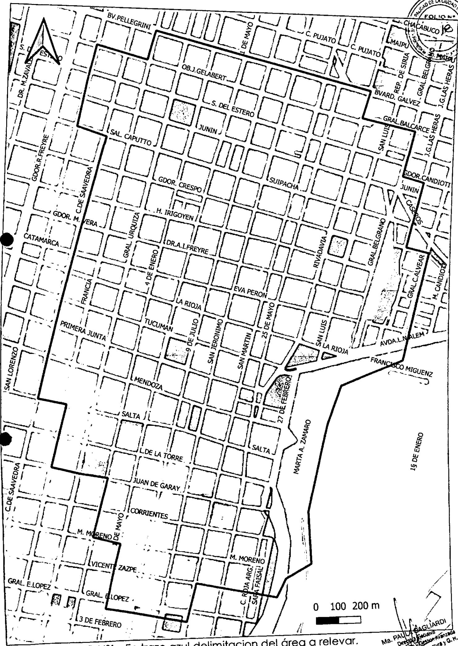
PLANO N.º 1 - En trazo azul delimitación del área a relevar.