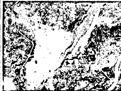
AFECTURA AV. FACUNDO ZUVERIA