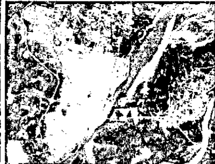
AFECTURA AV. FACUNDO ZUVERIA